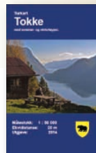
Kart: Tokke 1 : 50 000

Du har sjølv ansvar for tryggleiken undervegs. Ta omsyn til naturen og beitande dyr. Gjer vel å ta med søppel heim. God tur!